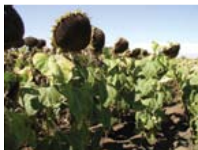
Tratat cu Tanos® 0,4 kg/ha