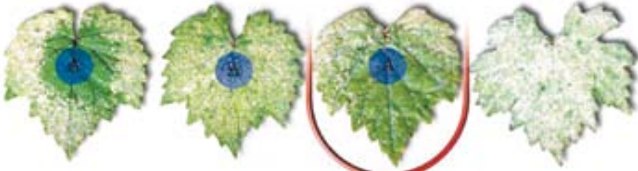
Produs sistemic (triazoli)