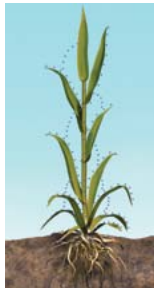
Distribuirea în faza de vapori